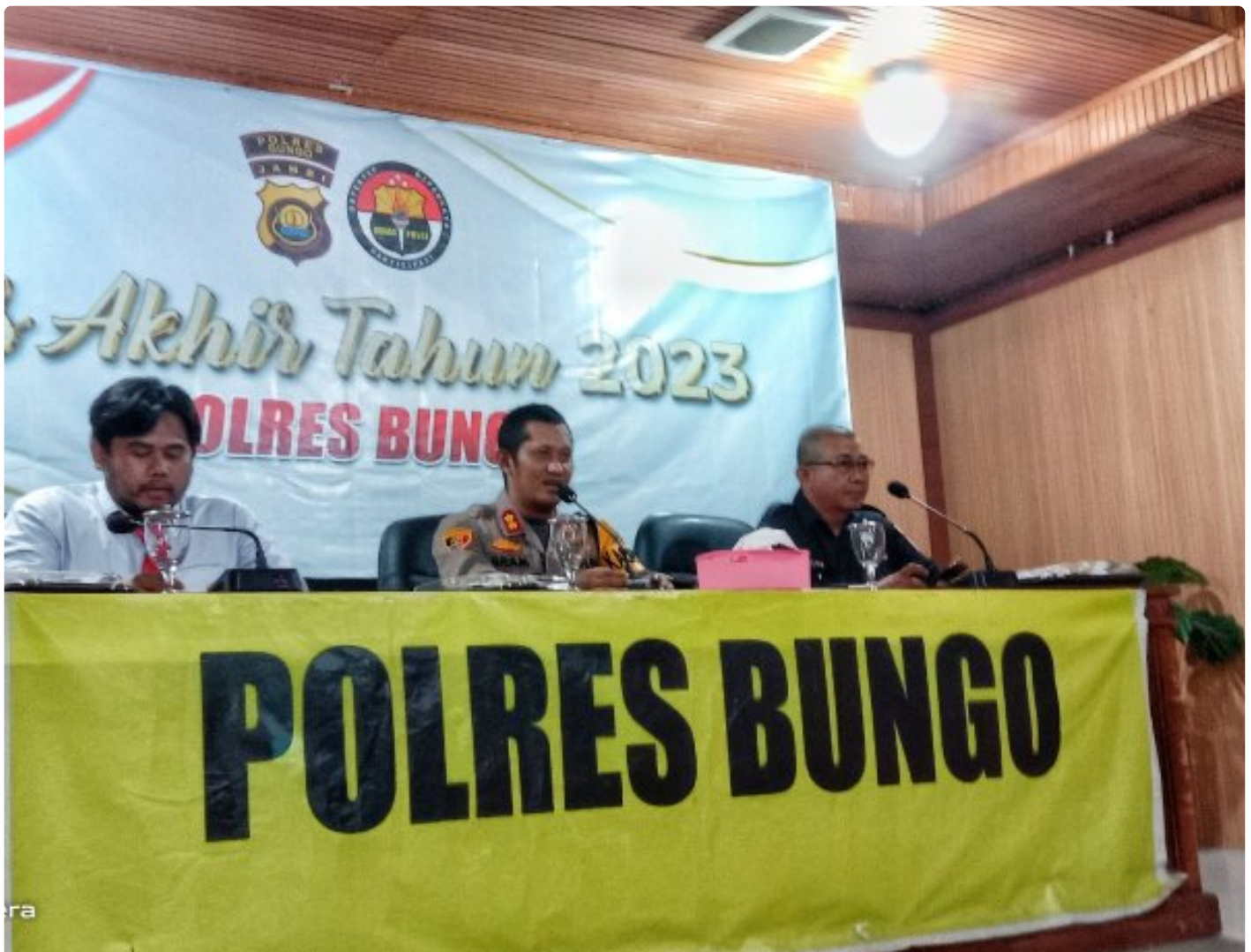
Kapolres Bungo, Kasat Resnarkoba, Humas Polres Bungo

BUNGO - Kapolres Bungo merilis data lahir kinerja tahun 2023 pada (30/12/23), bertempat di lantai 2 aula polres Bungo.